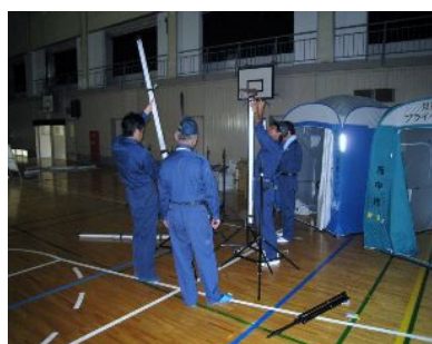
電力供給訓練状況

当協会は、災害時の被災者をはじめ広く一般市民を対象として、災害時等において 自助・共助 の観点に立ち、電気災害予防対策事業、電気災害応急・復旧事業及び電気災害に関する調査・知識の普及啓発事業をこの府中市防災訓練との連携で活動いたしました。