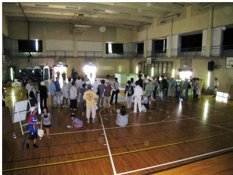
一般市民への避難所の説明風景

当協会は、災害時の被災者をはじめ広く一般市民を対象として、災害時等において 自助・共助 の観点に立ち、電気災害予防対策事業、電気災害応急・復旧事業及び電気災害に関する調査・知識の普及啓発事業をこの府中市防災訓練との連携で活動いたしました。