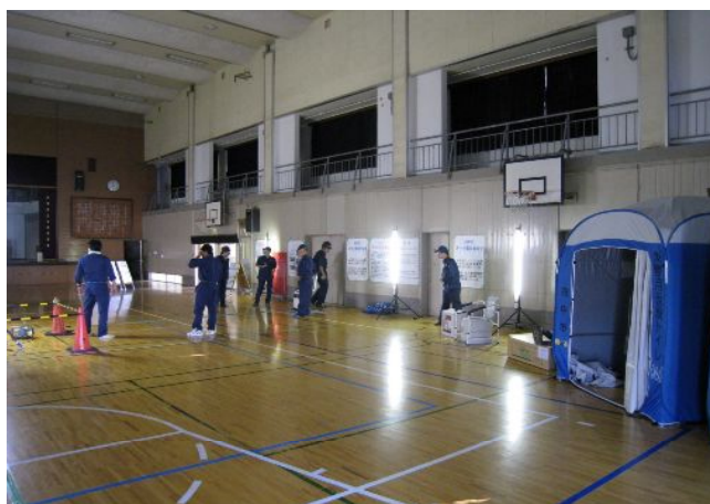
避難所の電源・照明支援状況